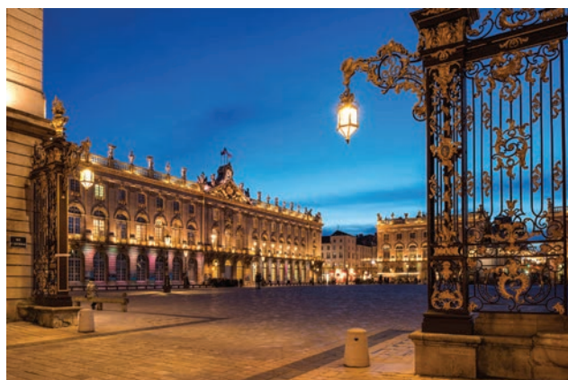
Au sein de l'Institut Lorrain de Formation en Masso-Kinésithérapie 57bis, rue de Nabécor - 54000 NANCY